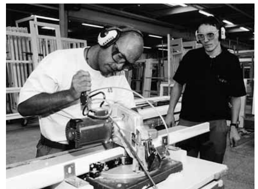
Praktische Einführung/Instruktion eines «Neuen».

Berufsunfallrisiko in Abhängigkeit von der Anstellungsdauer (1993–1997). Die Grafik zeigt, dass das Unfallrisiko in den ersten Monaten der Anstellung markant höher ist als bei Personen, die seit zwei und mehr Jahren angestellt sind (= Risiko 1,0).