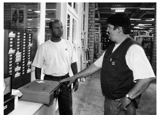
... und hier der Standort des Verbandskastens.

Es ist möglich, dass in Ihrem Betrieb noch weitere Aspekte zum Thema dieser Checkliste berücksichtigt werden müssen. Ist dies der Fall, treffen Sie die notwendigen Massnahmen (siehe Rückseite).