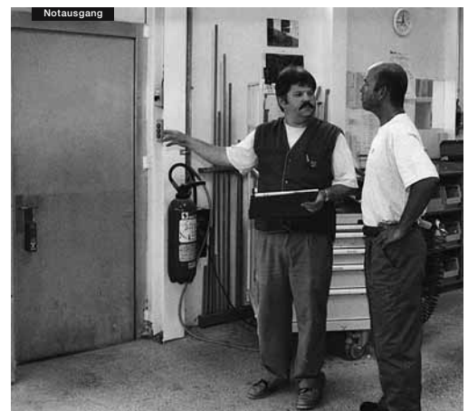
Hier befindet sich der Notausgang ...